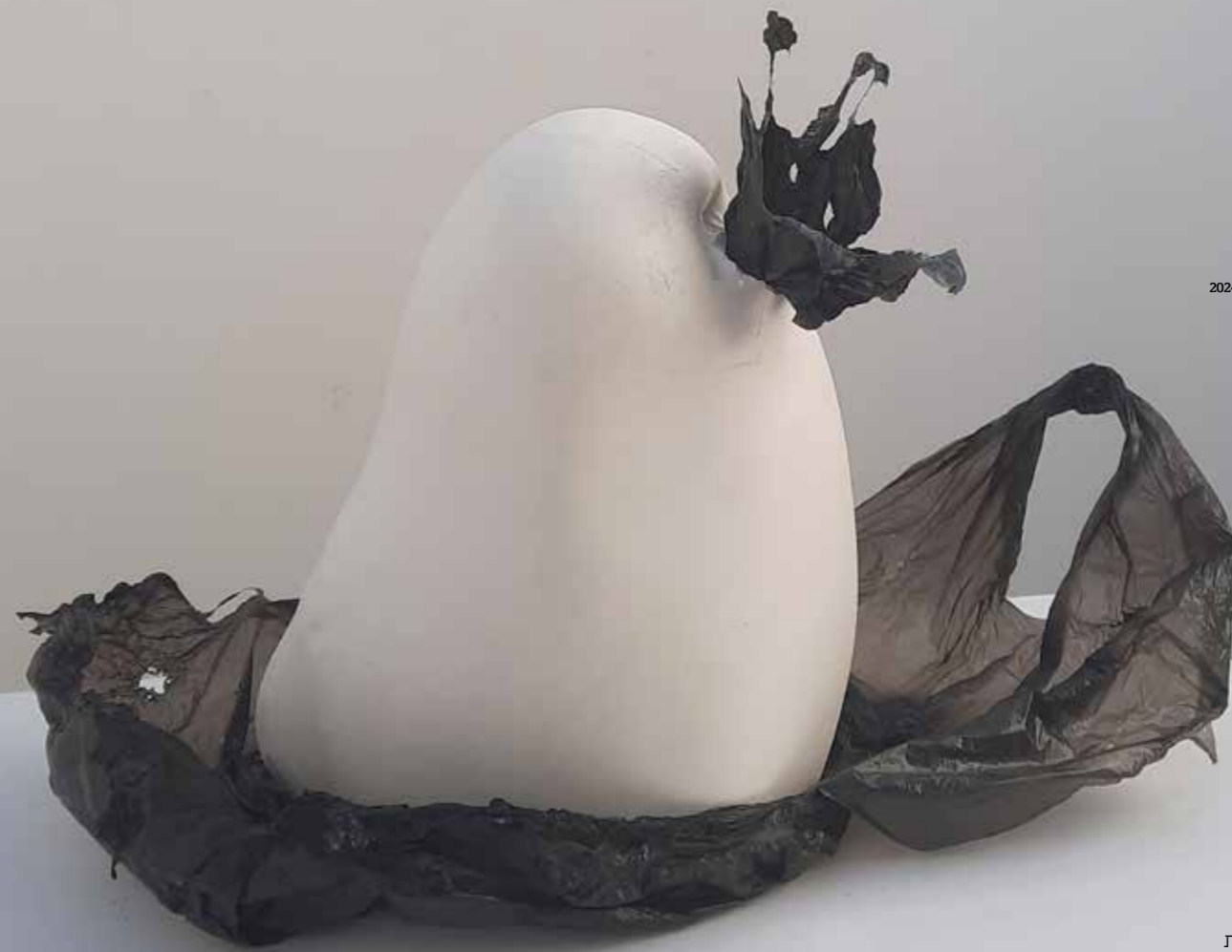
יואב שביט, פוף טכניקה מעורבת, 2024.