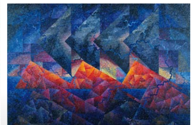
דגנית ברסט שקיעה עם שלושה עצים, 1991