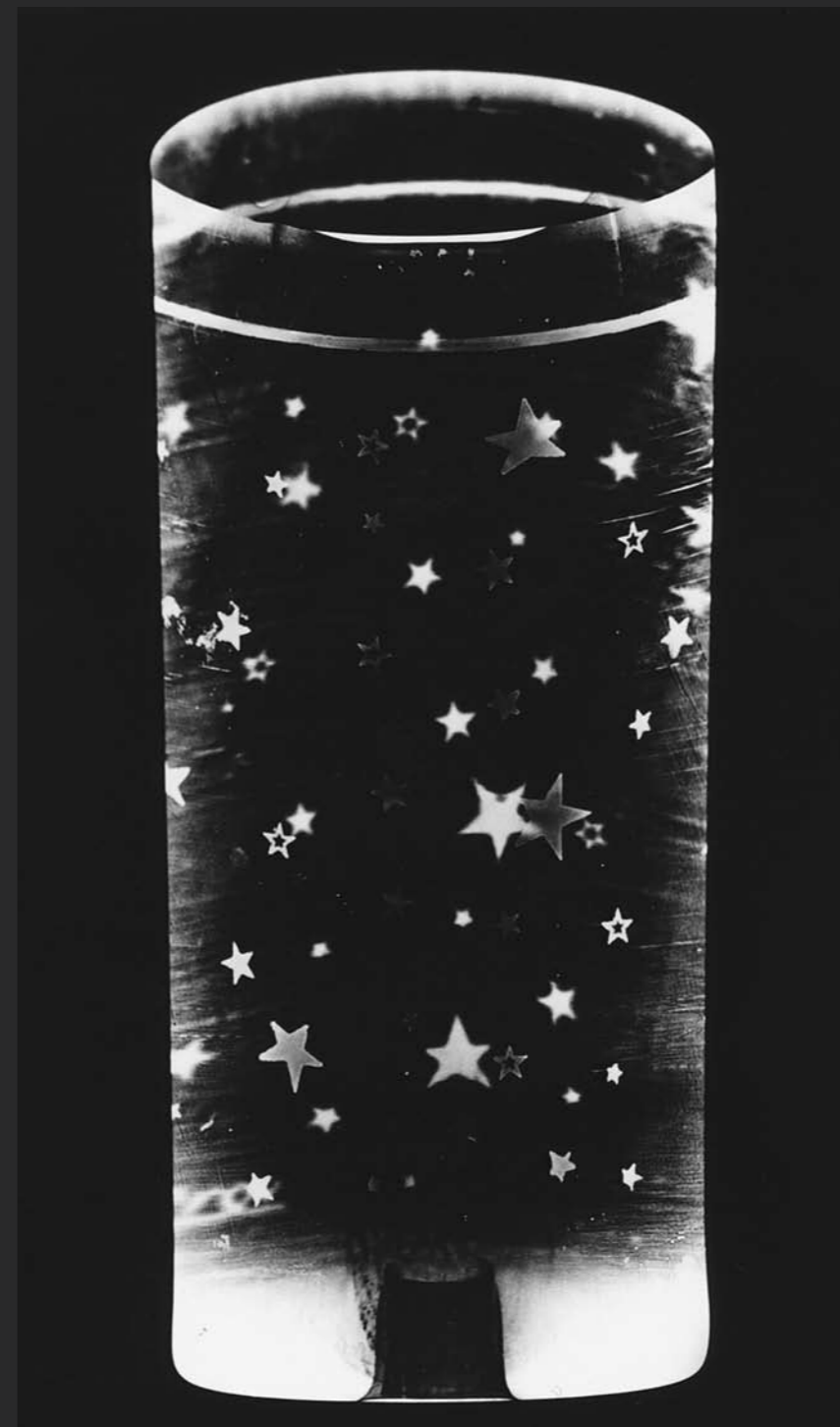
דגנית ברסט, כוס כוכבים, 1990