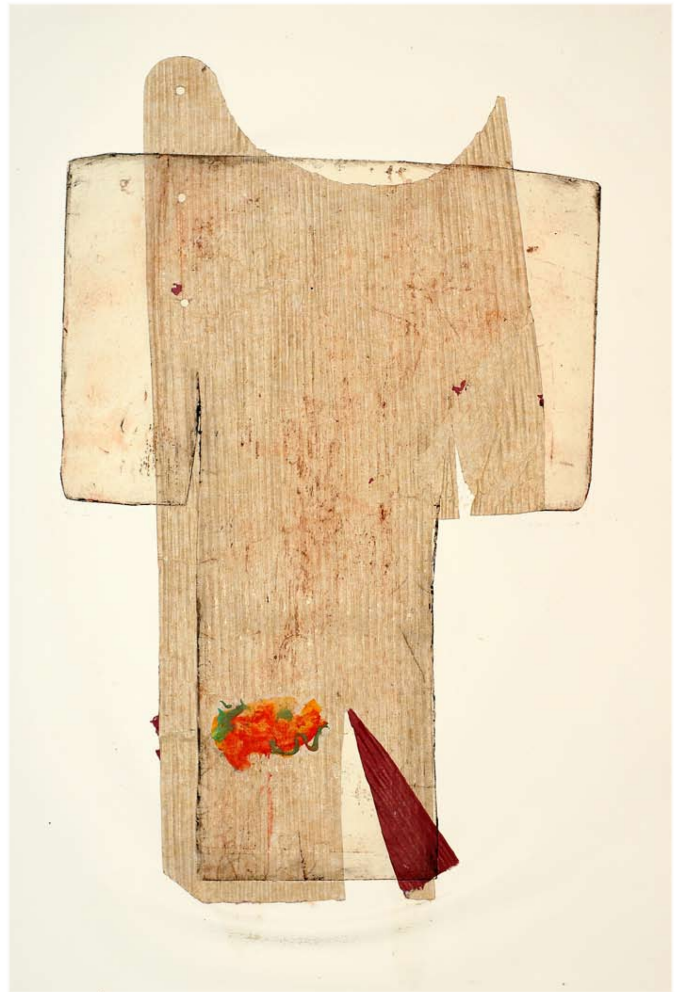
ג'ודי אורסתי-קימונו 2006