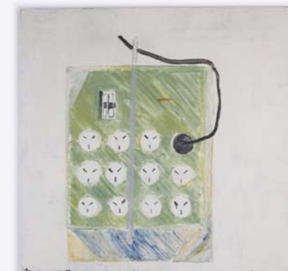
Ido Bar-El, Untitled , 1993, acrylic, industrial paint on plywood, 92x97x3 cm