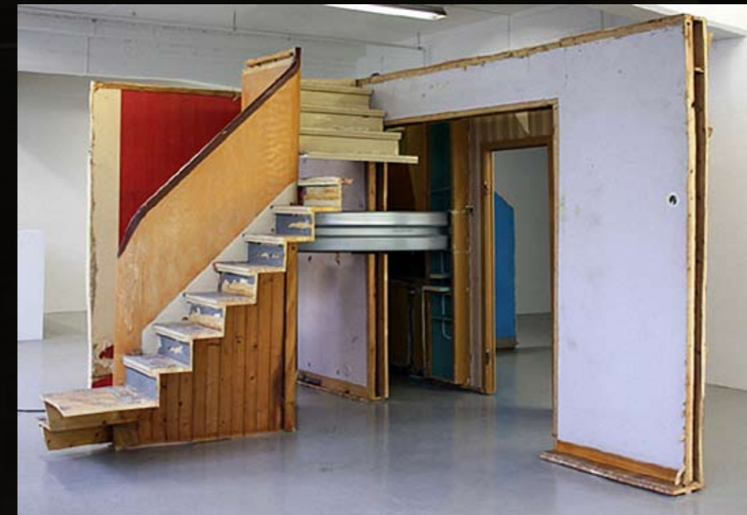
Florian Neufeldt, Cuts Both Ways, 2010, guard rail, motor, wood, 250x580x630 cm

עבודת הוידאו של רודה, כלבים נובחים לא נושכים, עוקבת אחר רצף המנגנונים המופעלים בעקבות השלכת פצצת עשן בתוך חלל מסחרי ריק, במקרה זה חלל גלריה. רודה מתעדת במקביל מתוך פנים החלל ומחוצה לו, וחושפת רצף מתוזמן של התרחשות אוטומטית, המתקבלת באדישות מצד הרחוב. מנגד, נויפלד חוצב ומחליף בין פיסות קיר בחלל הגלריה עצמו, ובתהליך חושף את המבנה הפנימי של קיר הגבס, ומתוך כך, גם את ארעיותו.