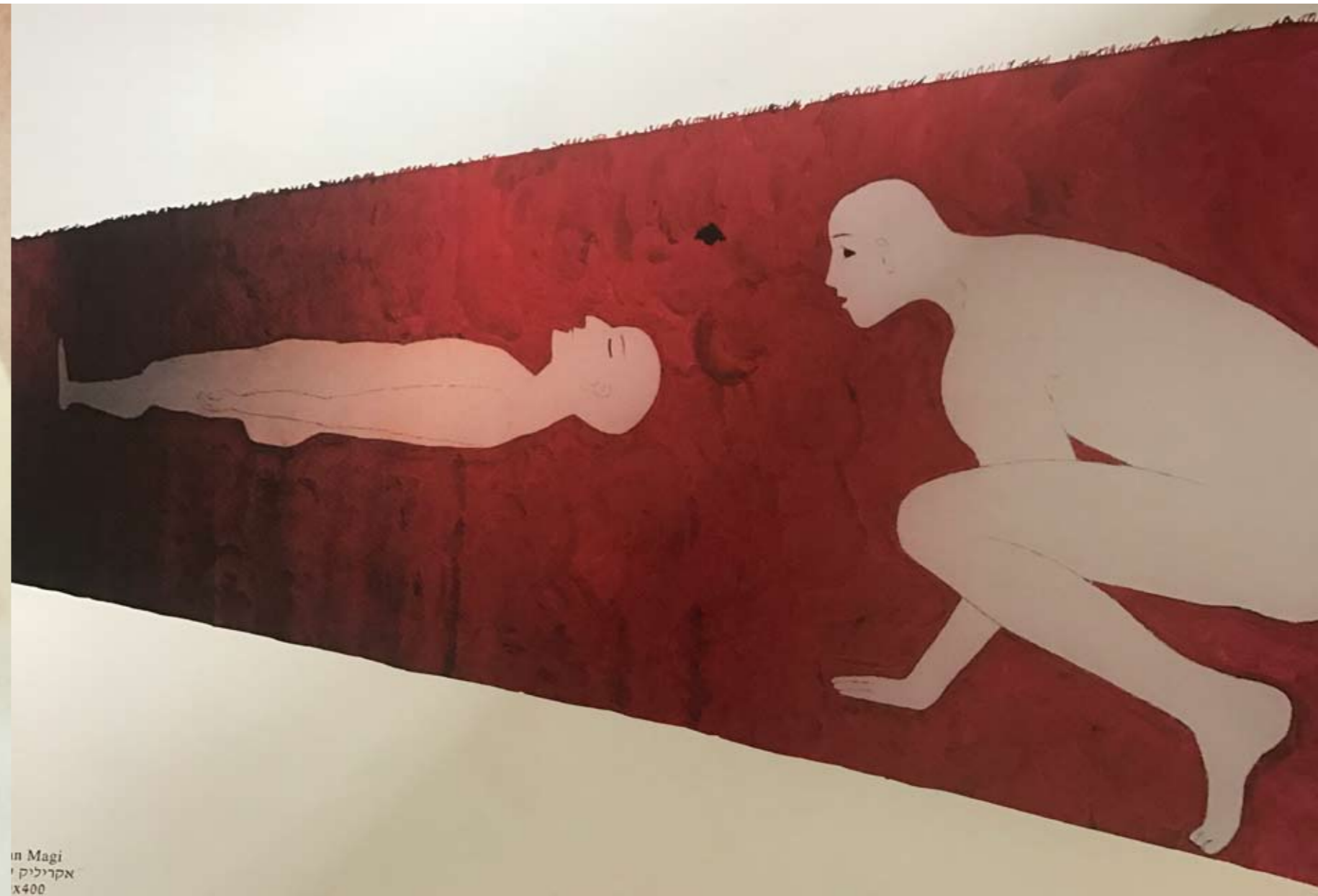
in Magi אקריליק x400