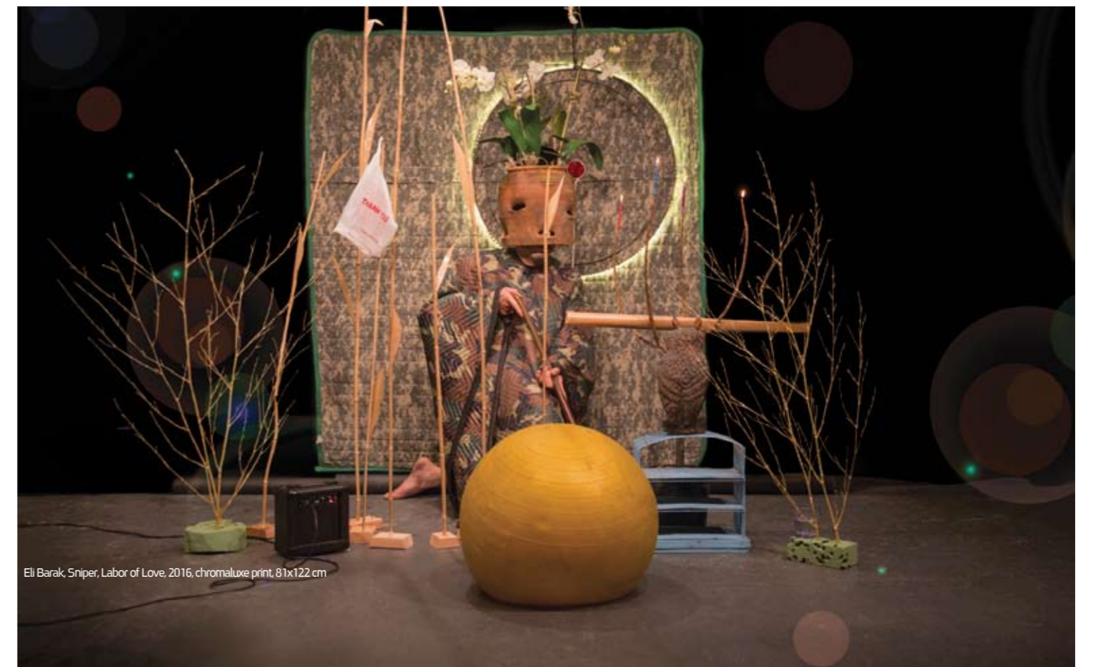
Eli Barak Sniper, Labor of Love, 2016, chromaluxe print, 81x122 cm