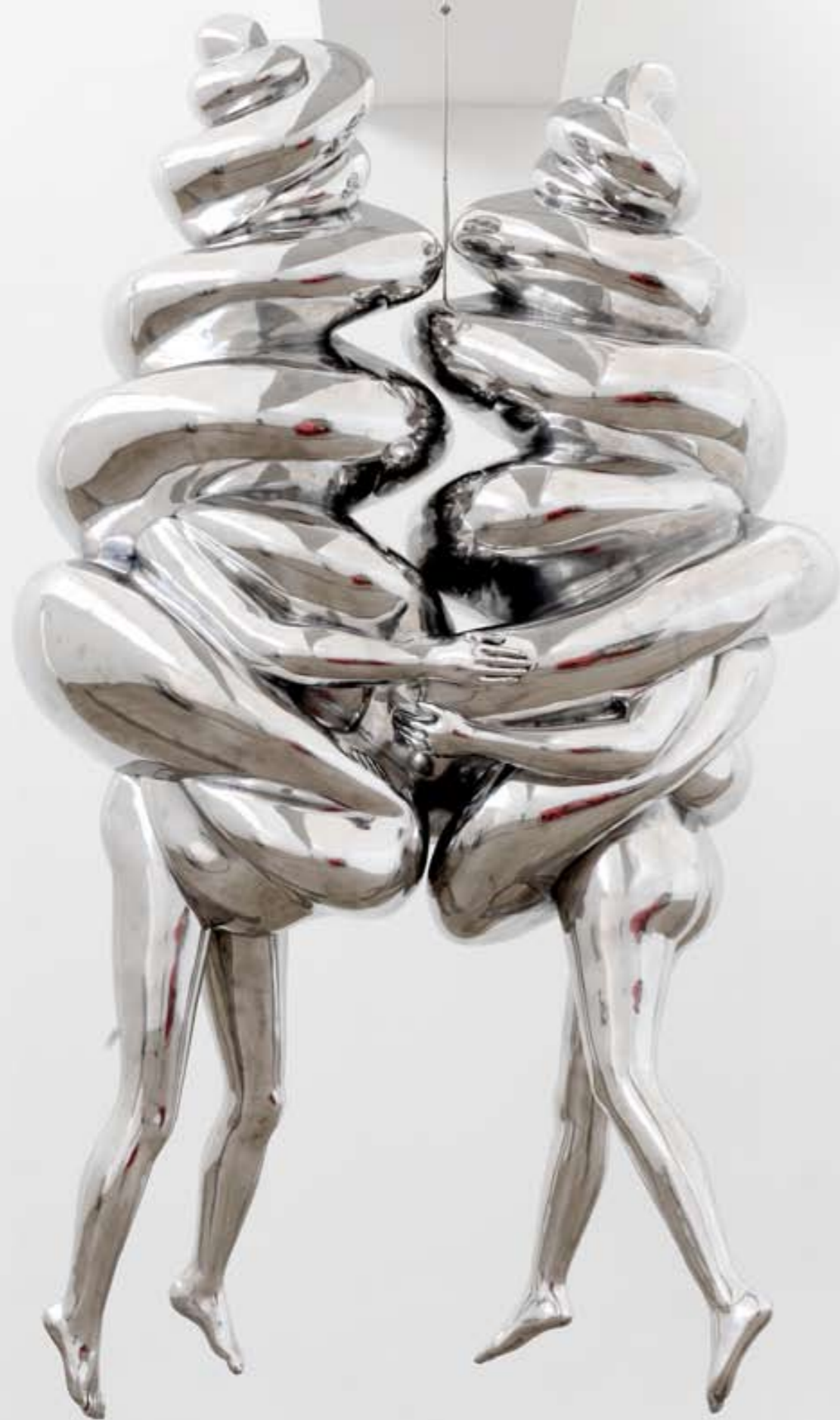
לויז בורדואה הזוג 2003, אלומיניום (עבודה תלויה)