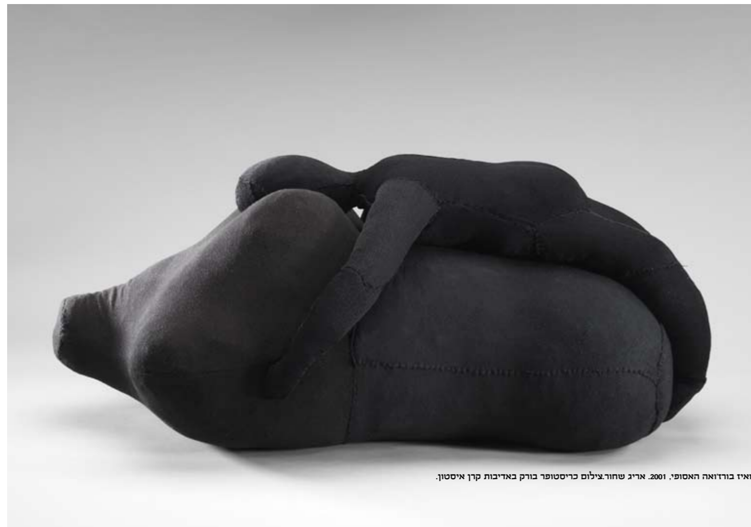
לואיז בורדואה האסופי, 2001. אריג שחור צילום כריסטופר בורק באדיבות קרן איסטון.

Curators: Jerry Gorovoy and Suzanne Landau