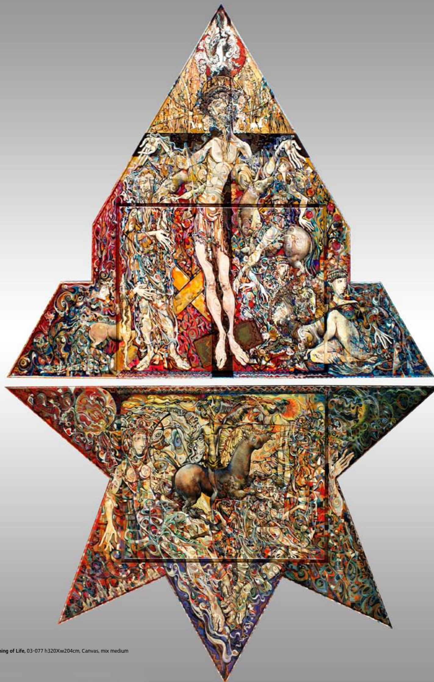
Meaning of Life, 03-077 h320xw204cm, Canvas, mix medium