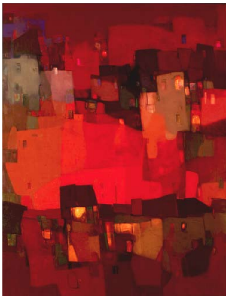
Mamuka Didebashvili 16-049 City in the Night, h130xw100cm, Canvas, oil