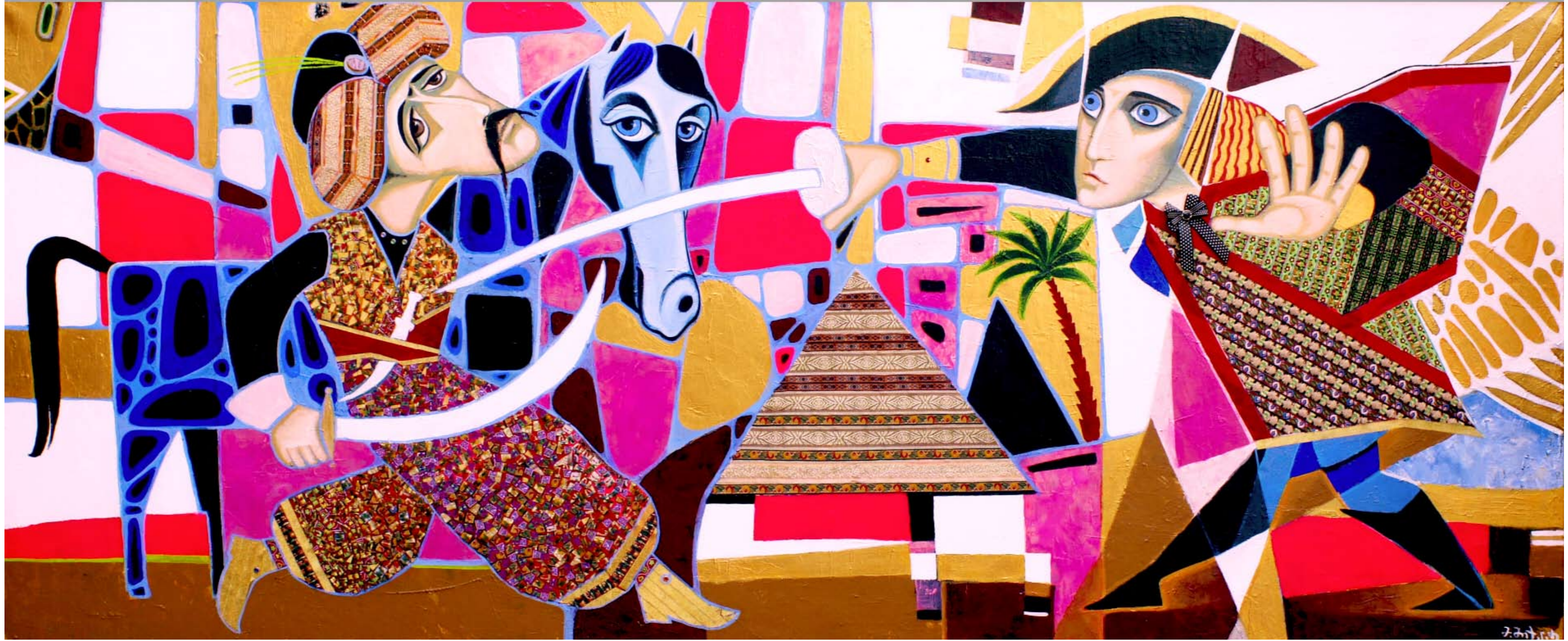
Mamuka Mikeladze 02-050 Capture of Egypt, h103xw243cm, Canvas, acryl